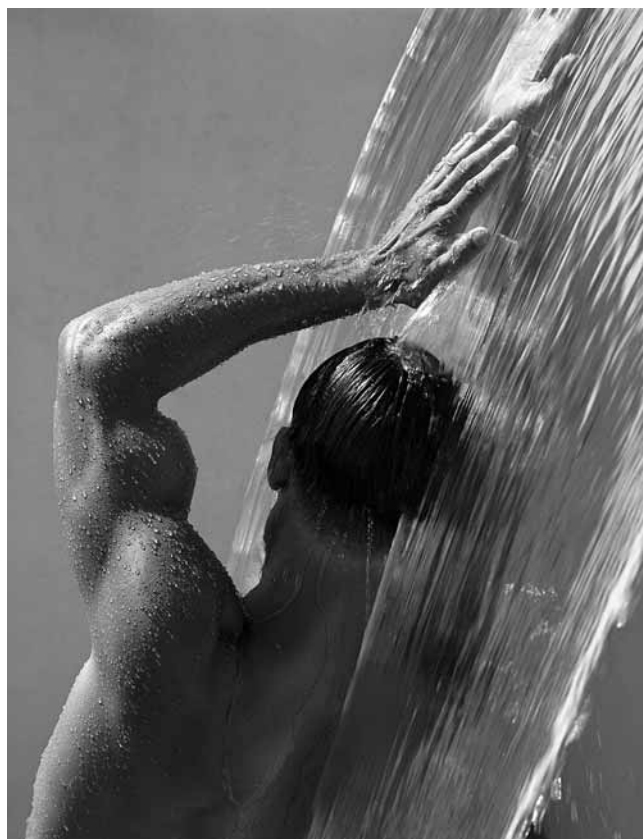
Waterfall IV, Hollywood 1988 , © Herb Ritts. Courtesy Herb Ritts Foundation

His images graced the covers of Vogue , Vanity Fair , and Rolling Stone . He created memorable advertising campaigns for Armani, Calvin Klein, Chanel, Donna Karen and Versace. His photography has been the subject of numerous exhibitions since 1985. "Body" concentrates on the male and female nude, the exhibition consists of vintage silver gelatine and platinum prints.