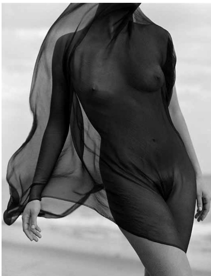
Female Torso With Veil , © Herb Ritts. Courtesy Herb Ritts Foundation

Le sue immagini hanno fatto da copertina a Vogue , Vanity Fair , e ai Rolling Stone . Ha creato delle campagne pubblicitarie memorabili per Armani, Calvin Klein, Chanel, Donna Karen e Versace. Le sue fotografie sono state in mostra a diverse esposizioni dal 1985. "Body" si concentra sul nudo femminile e maschile, la mostra consiste in stampe vintage di gelatina d'argento e al platino.