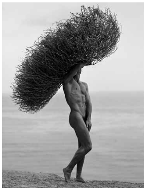
Male Nude With Tumbleweed

In a twenty year span of enormous creativity most often associated with fashion and celebrity portraiture, Herb Ritts returned time and again to the human body to express both strength and beauty. His admiration for the classical expressed in abstracted, strong, clear forms and his renowned interest for the human body linked him to a photographic lineage that can be easily traced to Edward Weston's modernist peppers and nudes as to Eadweard Muybridge's classical studies of the body in motion.