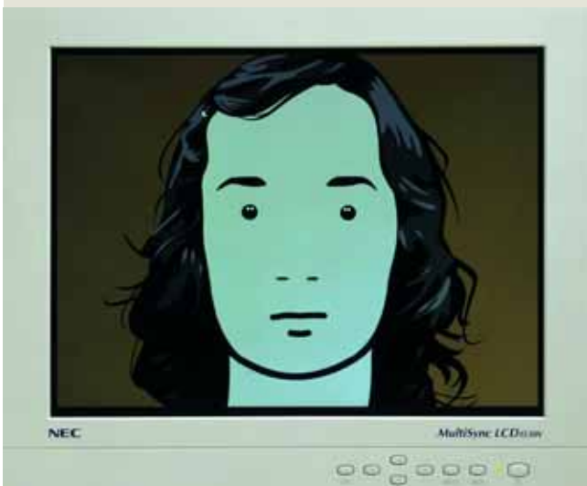
Julian Opie, "This Is Fiona, 2000" DVD and LCD screen Continuous loop.