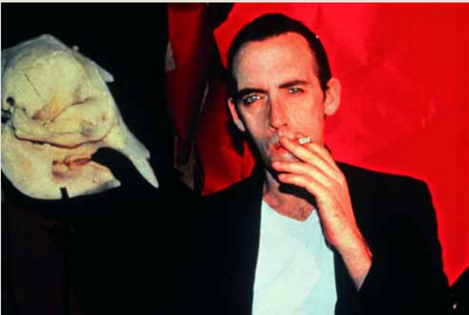
Nan Goldin, David Wojnarowicz at Home, NYC, 1990.

Over forty years ago, Andy Warhol promoted the concept that artists are celebrities, just as worthy of portrayal as other cultural icons. "Likeness, Portraits of artists by Other Artists" begins where Warhol left off. "Likeness" proposes a recent history of artists' representations of other artists active in such cities as Berlin, London, Los Angeles and New York. This exhibition goes beyond the portrait representing also the social dynamics of certain milieus of contemporary art. "Likeness" investigates the various ways artists have re-imagined exactly what constitutes a portrait. These images reflect a dialogue in which the identities and status of both portrayers and portrayed are interrelated. Born of encounters between individuals who share similar social roles, these works make concrete the intimate dramas of the art world. This exhibition presents over fifty paintings, drawings and photographs, and several works in other media. Among the included works is Robert Mapplethorpe's photograph of Louise Bourgeois.